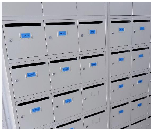
望院老旧信箱已更换