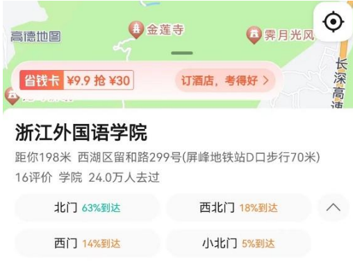
明确校门名称并同步至地图 APP