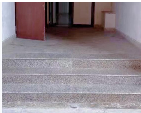
品院破损台阶已修复