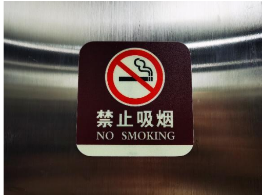
公共区域张贴禁烟标识